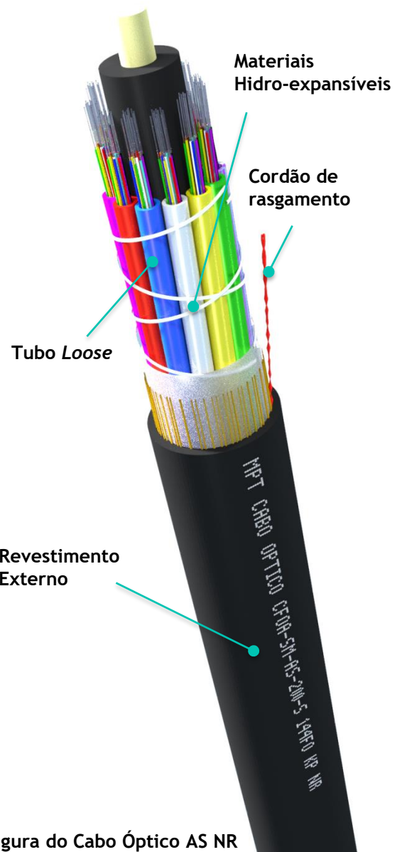
Figura do Cabo Óptico AS NR