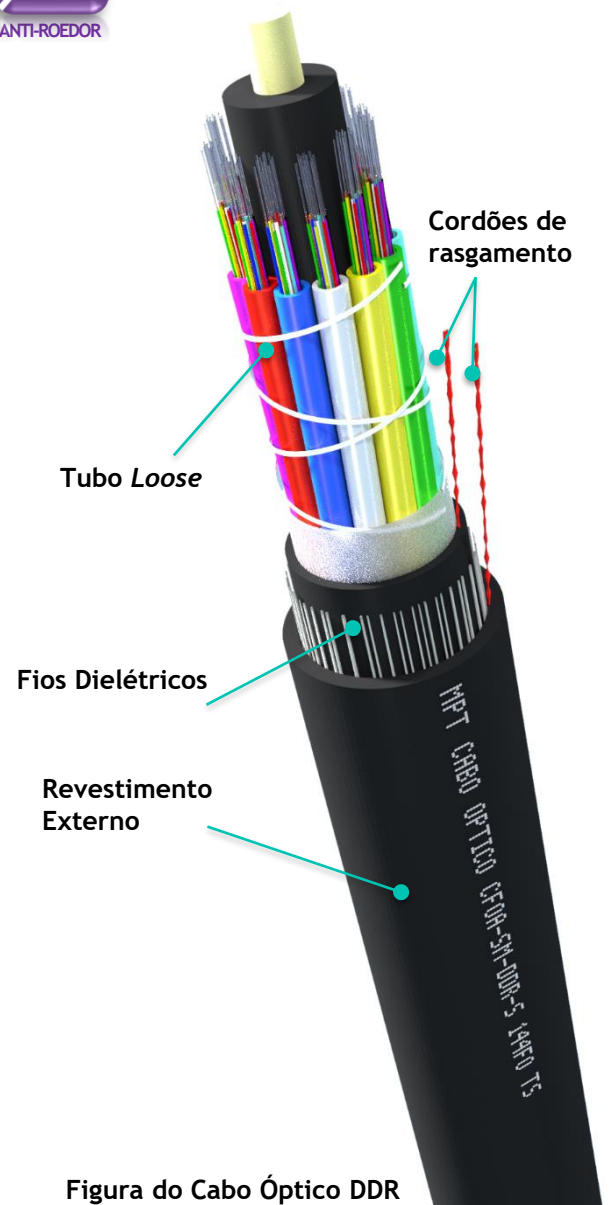
Figura do Cabo Óptico DDR